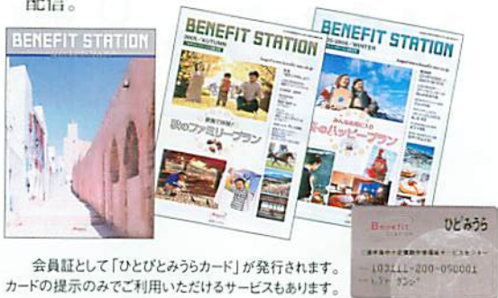
会員証として「ひとびとみうらカード」が発行されます。カードの提示のみでご利用いただけるサービスもあります。